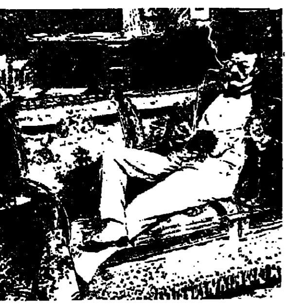
الانتصار بالبنائيات يحتاج الى رباطة جاس

المباني من الشعوب المريقسة القديمة التي ازدهرت في حوضها بين السهول الجديدة قبل اكتشافها زمن طويل وانهارت فتلقت خلفها آثارها وانقاض تصورها ومبانيها لتعبد على ما لبثته لاكثر من ألف سنة - المنطقة التي تضم الان غواتيمالا وبليز وتبته جزيرة بوكاتان في امريكا الوسطى . الان تلك الحضارة انهارت فجأة حوالي سنة ٩٠٠ م . وقد حار علماء الآثار في تحليل اسباب ذلك الانهيار فسي حين انهم يحاولون معرفة اصل تلك الحضارة وكيف نشأت وازدهرت . وما علمونه عنها انها كانت حضارة راقية متقدمة في زمانها وسط الادغال الاستوائية وكان تعداد سكانها يزيد على المليونين نسمة . ويجد علماء الآثار الباحثون في حضارة المايا منذ زمن طويل لمعرفة كيف تمكن المزارعون الغدائية في تلك الاراضي الموحلة التي تغلب عليها المستنقعات وسط الادغال . ويظهر ان هذا اللغز الذي طالما حيرهم قد تمكن الان حلته باستخدام تكنولوجيا الفضاء . فقد استعملوا جهاز امدار من نوع خاص استعمل مؤخرًا في الرقبة الفضائية التي ارسلت الى كوكب الزهرة لتصوير سطحه من خلال السحب الكثيفة في غلاسه الجوي . والتعد هذا امدار - اثناء الاختبارات التي اجريت عليه قبل ارساله الى الفضاء - صورًا لاقتل غواتيمالا وبليز المغطاة عادة بسحب الامطار الاستوائية